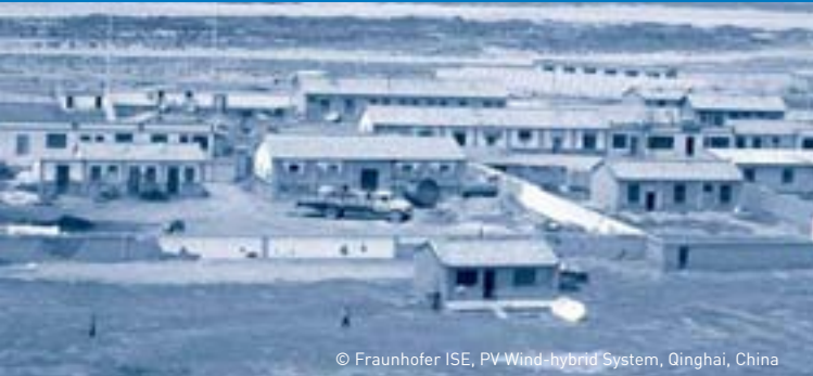
PV-Wind-hybrid System, Qinghai, China