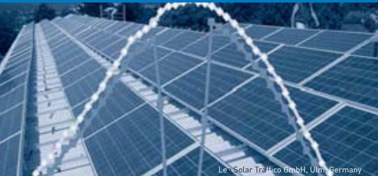
Leo Solar Traffico GmbH, Ulm, Germany