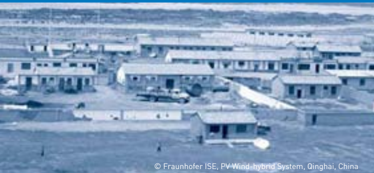
PV-Wind-hybrid System, Qinghai, China